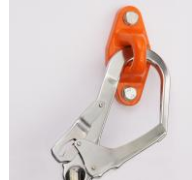
Anpo med AZ 022