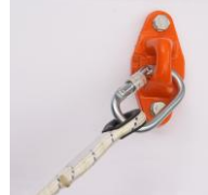
Anpo med AZ 011

Normal pris kr. 99,00 Intropris kr. 79,00